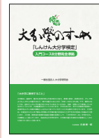
▲「大分学のおすすめ」(大分学研究会刊) 2024年6月

〔入門コース〕 100問のうち60問以上は枠で囲んだ参考書1冊の内容から出題します。