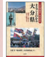
▲「まるごとわかる大分県」(明石書店刊) 2014年9月