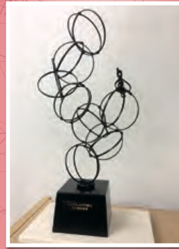
「マスターコース」最高得点者に贈られる 特製竹トロフィー「湯けむり」