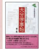
▲「大分学事始」第1集(大分学研究会刊) 2018年10月