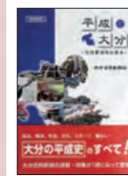
▲「平成と大分」(大分合同新聞社刊) 2019年7月