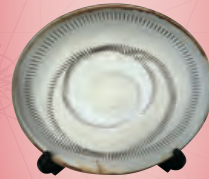
「しんけん大分学検定」特製 小鹿田焼 郷土料理本(初回検定者のみ)